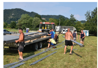
Priprave na veselico