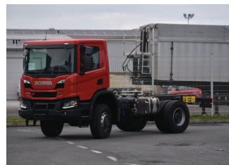
Podvozje novega gasilskega vozila GVC-3