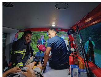
Padeč kolesarja v Dolenji vasi