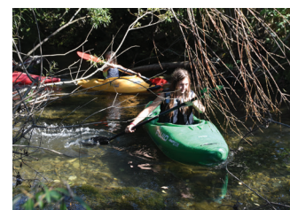
Noč z gasilci – kajakaštvo v Termah Briše