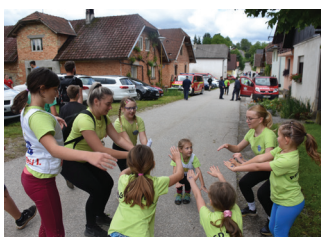
Ogrevanje pred regijsko orientacijo v Dvorski vasi