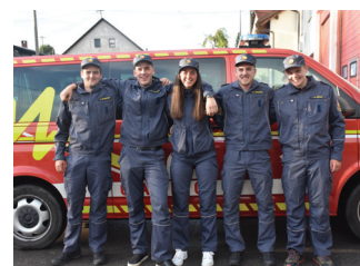
Novi operativni gasilci