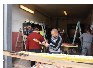
Preureditev garaže pred prihodom novega vozila