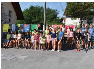
Udeleženci Noči z gasilci

Velik dogodek za naše društvo je bilo regijsko tekmovanje v gasilsko-športnih disciplinah, ki smo ga konec septembra organizirali na atletskem stadionu Policijske akademije v Tacnu. Na tekmovanju, kjer je sodelovalo skoraj 1000 otrok, so naše pionirke in mladinci s suvereno zmago dosegli uvrstitev na državni nivo. Organizacija takšnega dogodka je zahtevala obsežne priprave, zato se zahvaljujemo vsem članom društva, ki so nesebično prispevali k brezhibni izvedbi.