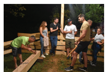
Žebli mahn na veselici