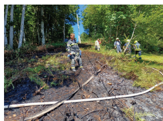
Travniški požar v Gabrjah