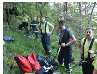
Ponovitev znanja reševanja na strmem pobočju