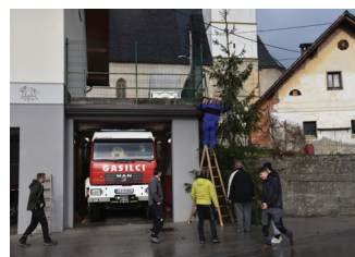
Priprave na silvestrovanje