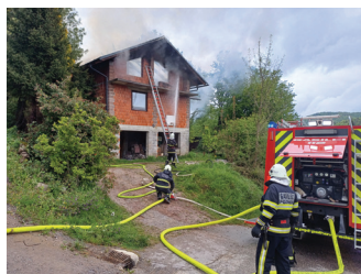
Požar hiše na Podrebri