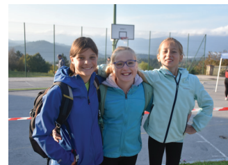
Pionirke na državni orientaciji na Medvedjem Brdu