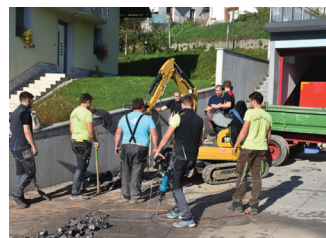
Ureditev dvorišča pred novo asfaltno prevleko

V juniju smo organizirali tudi 9. družinski pohod gasilskih društev sektorja Polhov Gradec na Lovrenc, kjer smo skupaj uživali v dobri družbi in športnih izzivih.