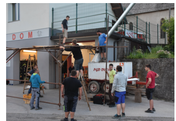
Postavitev peči za Vikend dvorskih pic