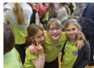
Pionirke na občinskem kvizu v Preserjeh