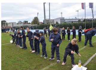
Družabne igre na srečanju slovensko – hrvaške mladine v Koprivici