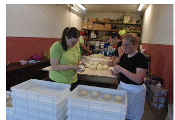
Izdelava hlepčkov za pice na Vikendu dvorskih pic