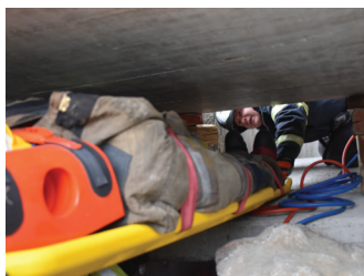
Vaja reševanja izpod ruševin