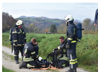
Vaja ob pregledu društva v Dolenji vasi