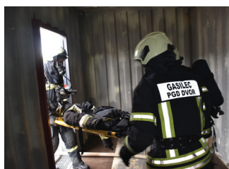
Vaja gašenja notranjih požarov na vadbenem poligonu v Notranjih Gorah