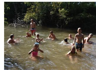
Noč z gasilci – kopanje v Gradaščici