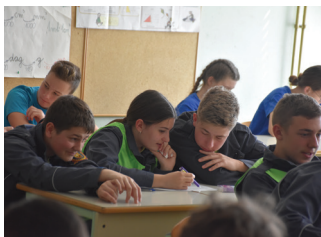
Mladinci na državnem kvizu v Račah